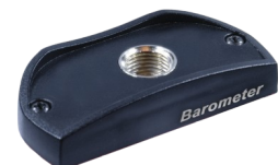
Universalport für den Anschluss unterschiedlichster Druckanschlüsse.