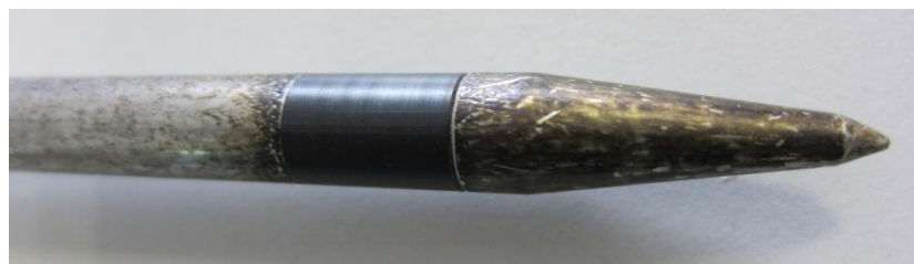
Verunreinigte Elektrodenspitze -> misst falsch!

Insbesondere Messungen in sehr feuchtem Heu können starke Verunreinigungen hinterlassen, die die Messung verfälschen können.