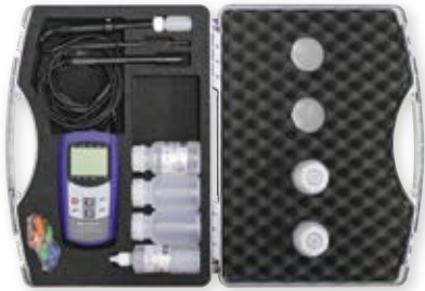
Einlage GKK 5001